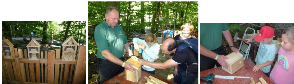
Erst bohren und nageln, dann einen fertigen Nistkasten mit nach Hause nehmen