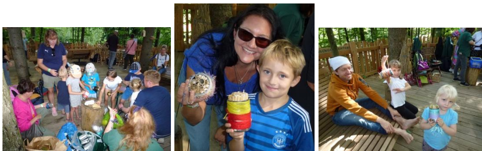
Jung und Alt sind stolz auf ihre Kunstwerke, und unsere Insekten haben ein paar Unterschlüpfte mehr zur Verfügung