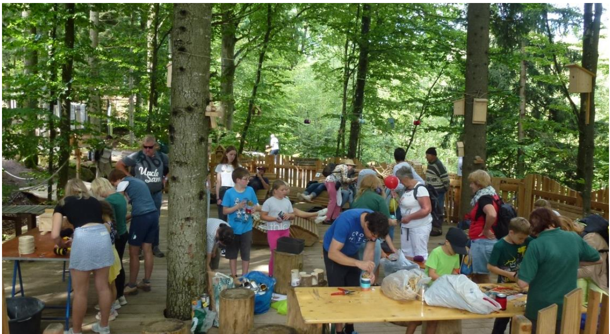
Jung und Alt bei der Endfertigung verschiedener Vogelnistkästen und Insektenhotels

Dann war es soweit: sieben Einsatzkräfte waren in Freyung vor Ort und haben als Erstes eine große Anzahl unterschiedlicher Nistkästen und Insektenhotels an den Bühnen-Bäumen als Anschauungsmaterial befestigt. Ab jetzt hatten die Akteure den ganzen Tag über alle Hände voll zu tun, um dem Ansturm von Naturliebhabern, wissbegierigen, lernwilligen Besuchern gerecht zu werden. Denn diese durften Vogelnistkästen und verschiedene Insektenhotels für sich befüllen bzw. fertigstellen und mit nach Hause nehmen. Außerdem waren die 12-seitigen Bauanleitungen recht gefragt. Jung und Alt waren sichtlich begeistert von dem Auftritt des Bayer. Wald-Vereins auf der Bühne „Wald-Heimat“ und das vielhundertfache „Dankeschön“ ist den Einsatzkräften noch lange nachgehallt. Fazit: eine erfolgreiche Werbe-Aktion sowohl für unsere Vögel und Insekten als auch für den Bayer. Wald-Verein.