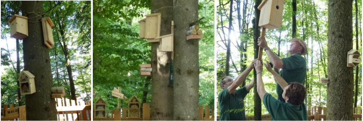
Gleich zu Beginn haben wir reichlich Anschauungsmaterial an den Bäumen befestigt: Nistkästen für verschiedene Vogelarten, Fledermäuse und natürlich ganz unterschiedlich gestaltete Insektenhotels