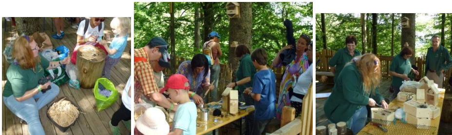
Die unterschiedlichen Arten von Insektenhotels mussten von den Besuchern nach ihren Wünschen endgefertigt werden und durften dann mitgenommen werden