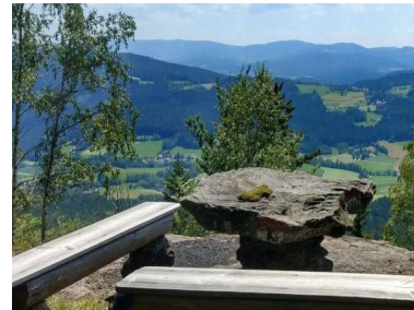
Plattenstein 788 m

Tourverlauf: Parkplatz Reitenberg – Plattenstein (788 m) – Räuber-Heigl-Höhle – Kreuzfelsen (999 m) – Mittagsstein (1034 m) – Mittagseinkkehr „Kötztinger Hütte“ – Hudlach – Parkplatz Reitenberg